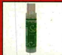
Aceite de masaje con aloe vera. Os dejará una piel fina como la seda. Jugad a masajearos. (Sensualove. 15,99€).