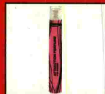
Perfume femenino que realza el olor natural de la piel y provoca atracción en los chicos. (Sensualove. 7,99€).