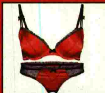
Conjunto de lencería en raso rojo y con encajes negros. (New Yorker. Sujetador: 12,95€; Braguitas: 6,95€).

Para estar divina en una noche de pasión con tu pareja, apunta estos productos. Te ayudarán a darle un toque morboso a tu imagen: