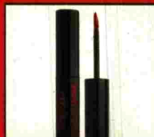
Brillo de labios rojo intenso con un efecto duradero. Podrás besarlo todo lo que quieras. (Deborah. 11,50€).