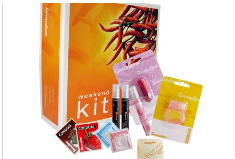
Gana con Nosotras un Kit Weekend de Sensualove