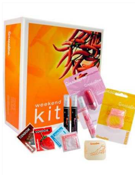
Gana un KIT WEEKEND de SENSUALOVE

El KIT WEEKEND de Sensualove incluye estimulante para mujeres y hombres , vibrador bala, anilla vibradora, un preservativo de fresa y otro de chocolate , lubricante natural, lubricante de fresa, aceite de masaje de fresa y un dado Kamasutra fosforescente.